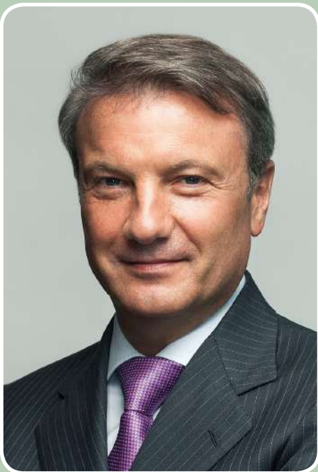
Г. О. Греф