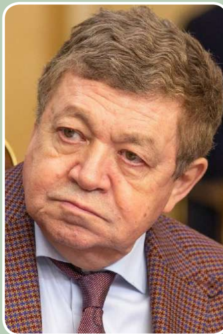
Р. С. Гринберг